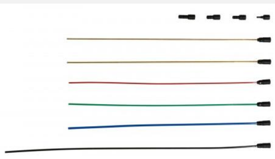
Zestaw sond w standardzie