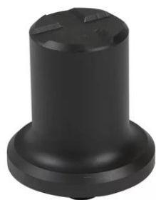
Przedłużka do samochodów o dużym prześwicie - 100 mm