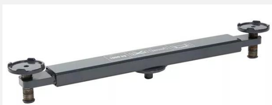
Trawers do podnoszenia samochodu w celu zmiany obu kół jednocześnie Z ramionami teleskopowymi, zasięg od 745 – 1150 mm