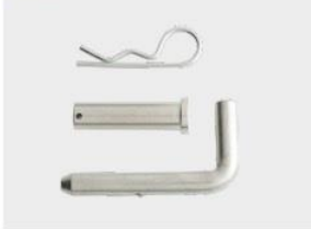
ET38 - ET72