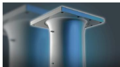
Solidne i trwałe cylindry powlekane chromem