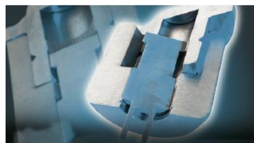
Wewnętrzna blokada ramion