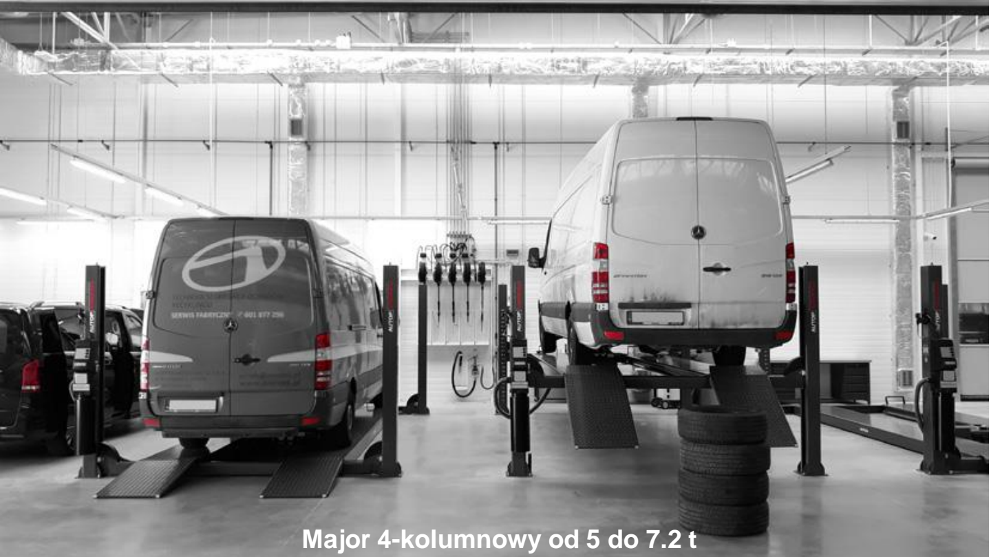
Major 4-kolumnowy od 5 do 7.2 t

Polecamy podnośniki najazdowe 4-stemplowe oraz 4-kolumnowe o udźwigach od 5 do 7.2 ton