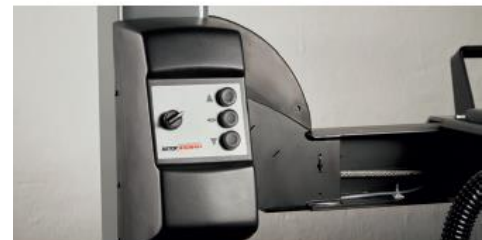
Skrzynka sterownicza na kolumnie