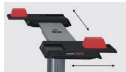
Przesuwne poprzeczne płyty XY