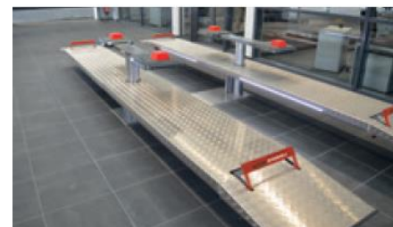
Podnośnik na recepcję