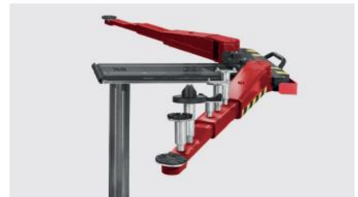
Szeroki wybór nadstawek