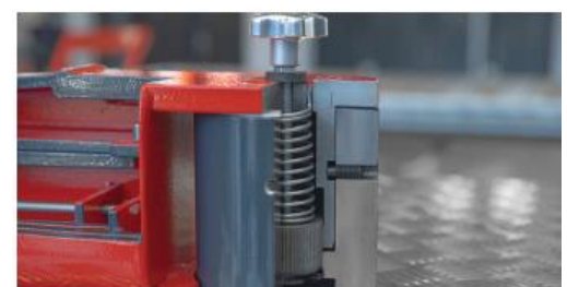
Wewnętrzny system blokady ramion