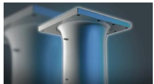
Solidne i trwałe cylindry powlekane chromem