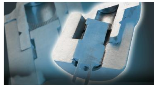
Wewnętrzna blokada ramion