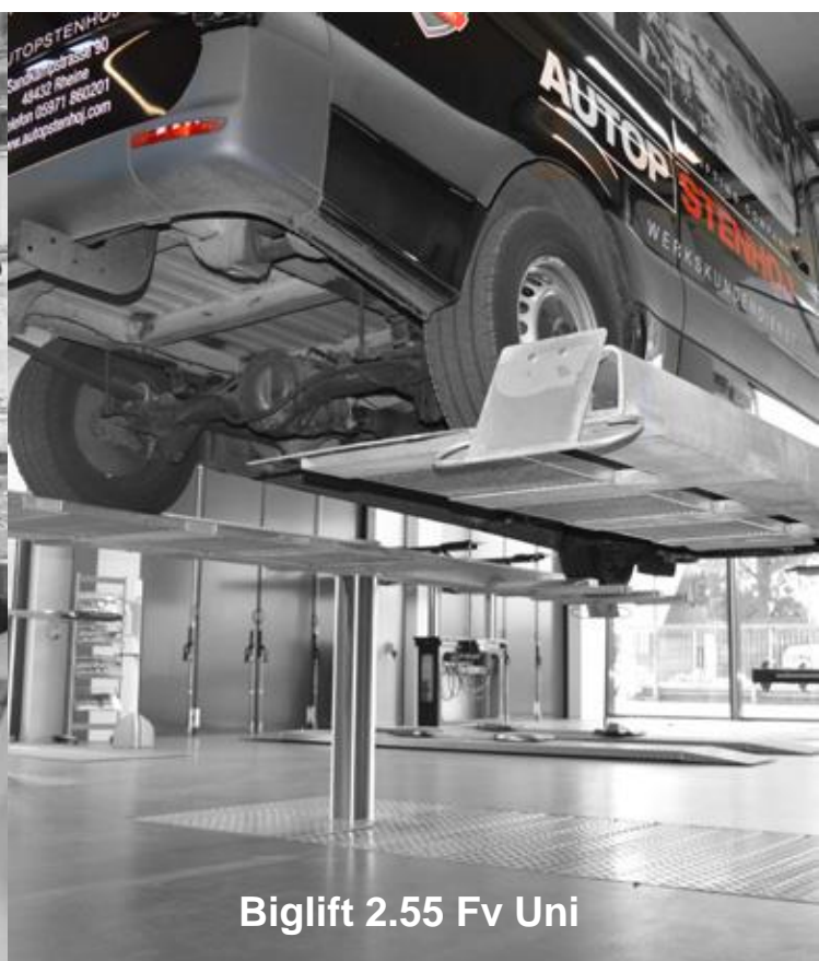
Biglift 2.55 Fv Uni

Polecamy podnośniki najazdowe 4-stemplowe oraz 4-kolumnowe o udźwigach od 5 do 7.2 ton