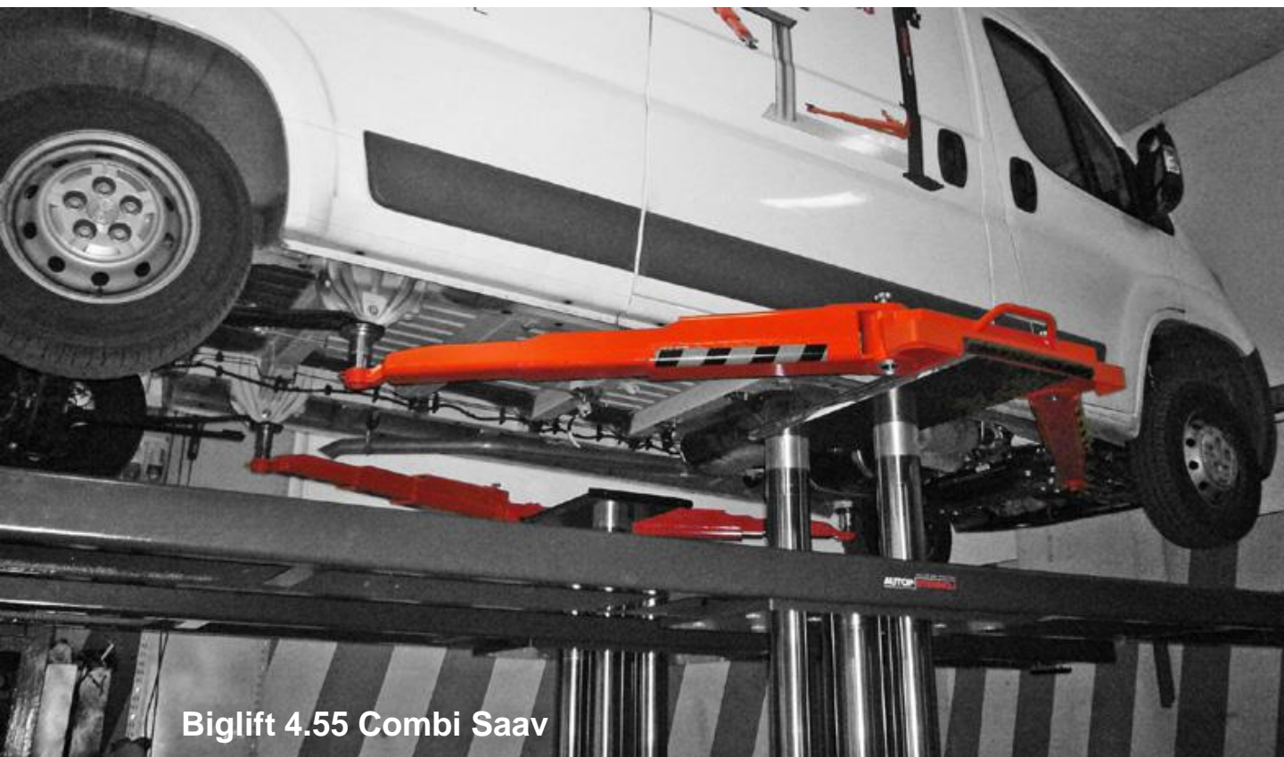
Biglift 4.55 Combi Saav

Polecamy podnośniki najazdowe 4-stemplowe oraz 4-kolumnowe o udźwigach od 5 do 7.2 ton