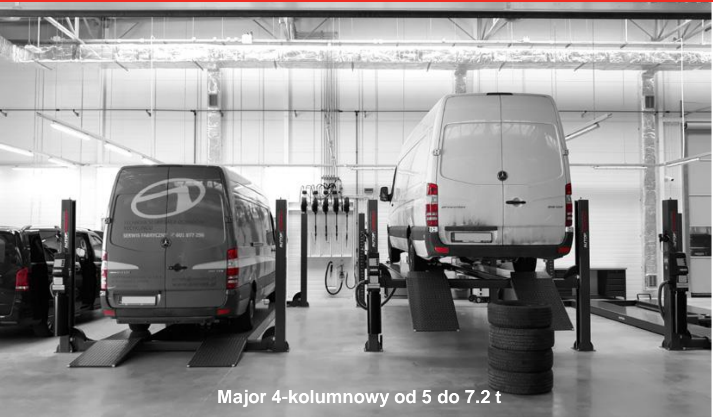
Major 4-kolumnowy od 5 do 7.2 t

Polecamy podnośniki najazdowe 4-stemplowe oraz 4-kolumnowe o udźwigach od 5 do 7.2 ton