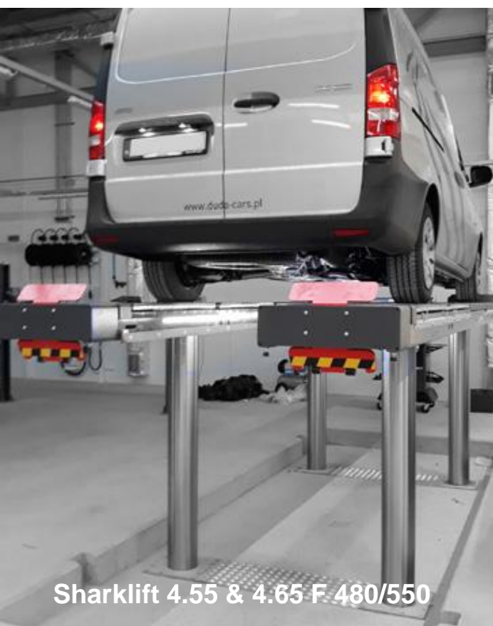
Sharklift 4.55 & 4.65 F 480/550