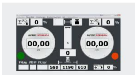
Wyświetlacz oprogramowania Basic