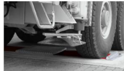
Wzmocniony zestaw rolek