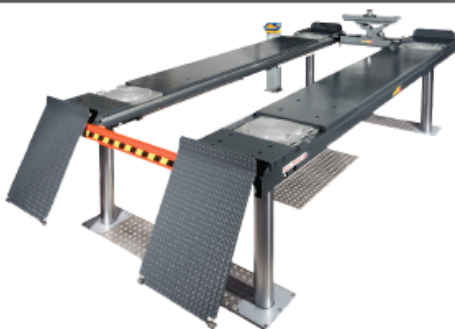
Quattrolift 4.50 F 480 BMW - 81220447735

Einfach auffahren, bei Bedarf radfreiheben des Fahrzeuges durchführen. Fußbodenbündiger Einbau – auch mit Fußbodenausgleich – ist ebenfalls möglich.