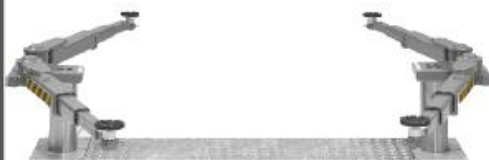
Masterlift 2.35 Saa 230 - 81220447732