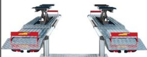
Masterlift 2.35 Fn 440 Check-in BMW 81210025160