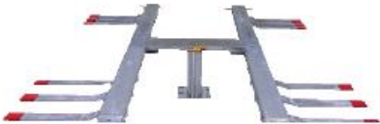
Sololift 1.35 Fv Uni - 81219429067

Hydraulische 1-Stempel Unterflur Hebebühnen mit 3,5 t Tragkraft in Kompaktbauweise für die Bereiche Wasch- und Autopflege sowie Reparatur und Wartung.