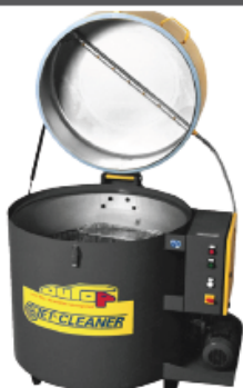
Jet Cleaner RC 82 81540433448

Diese 4-Stempel-Anlage besitzt eine außerordentliche Stabilität und erfüllt die Vorgaben zur Achsvermessung lt. BMW Lastenheft.